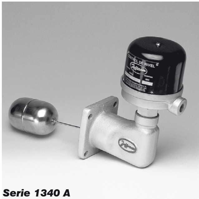
Serie 1340 A